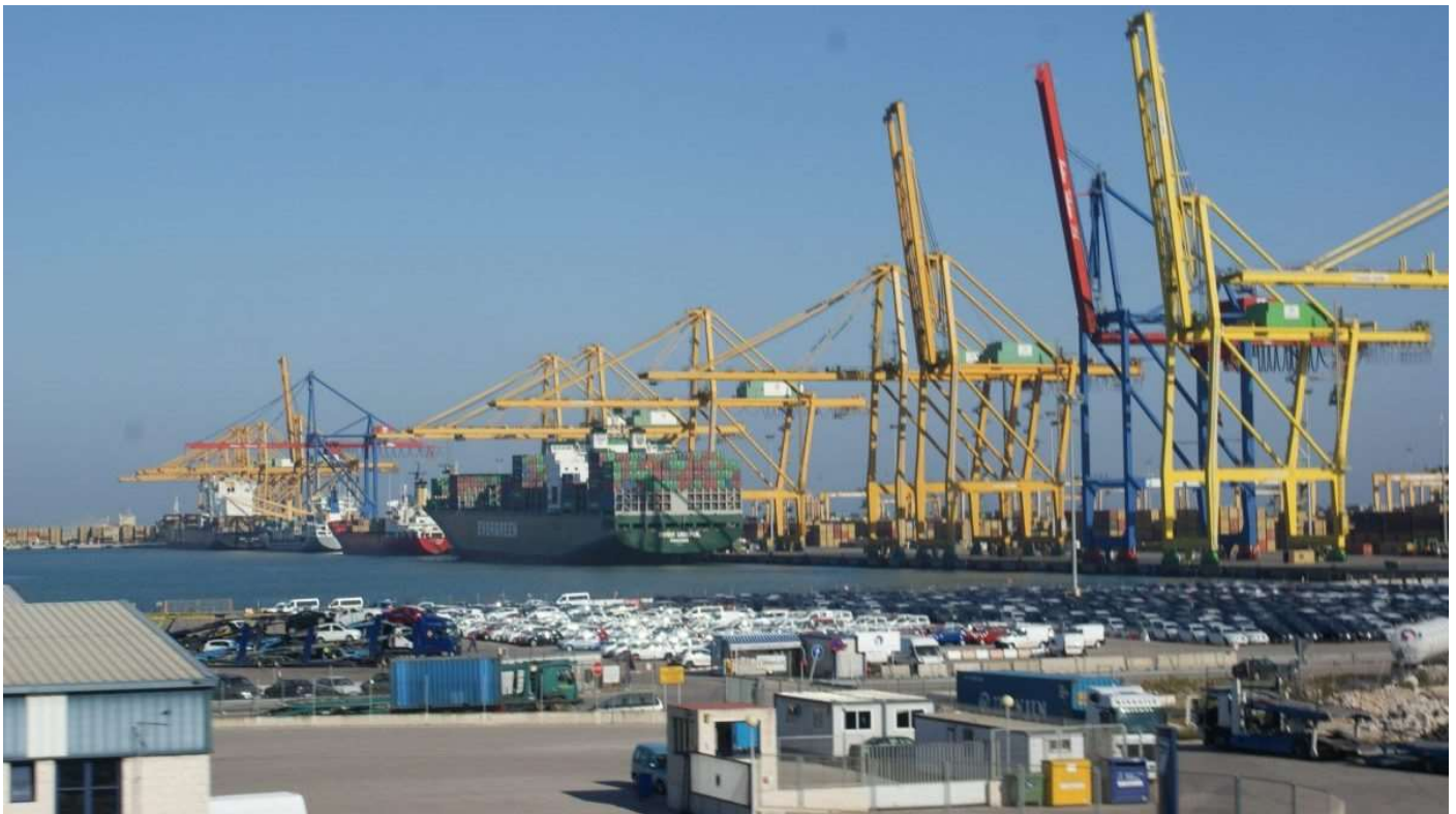
Puerto de Valencia | Fundación Valenciaport

El evento simulará un ataque de acceso remoto a la infraestructura informática y de tecnologías de operación y a la red de energía del enclave